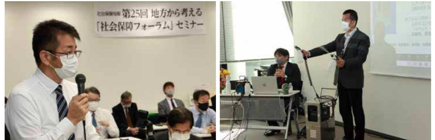
第25回 地方から考える「社会保障フォーラム」セミナーの様子

今後の状況に応じて、延期または全面的にオンラインセミナーとしての開催も想定しております。今後の連絡に関しましては、HPに告知するとともに、電話・Eメール等で個別にご連絡を申し上げます。